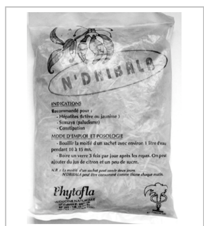
Figure 10 - Tisane N'Dribala.