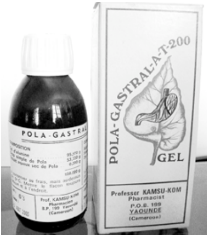
Figure 5 - E. coccinea Pola-Gastral A-T-200.