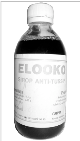
Figure 11 - Guiera senegalensis . Sirop Elooko.

souris transgéniques (transgenic sickle mice), ce produit enregistré au Nigeria et dans d'autres pays africains vient d'être accepté par la Food and Drug Administration aux Etats Unis comme médicament orphelin (10) et commercialisé sous le nom de Hemoxin par la société Xe chem. D'autres médicaments ont été enregistrés pour soigner la drépanocytose : Ciklavit (11) au Nigeria est un extrait de Cajanus cajan , au Togo, Drépanostat (12) (Fig. 7) est un extrait de Fagara xanthoxyloides additionné de paracétamol.