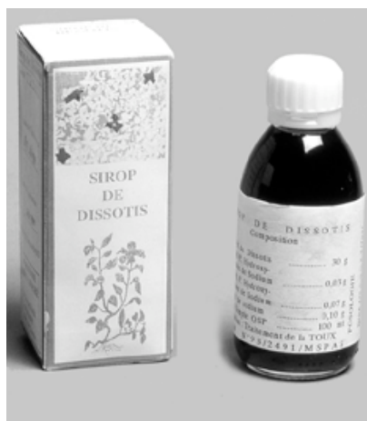
Figure 2 - Sirop de Dissotis rotundifolia