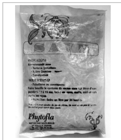
Figure 9 - Tisane Saye.