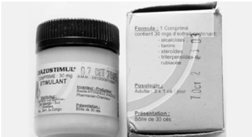
Figure 6 - Pausinystalia yohimbe - Diazostimul.