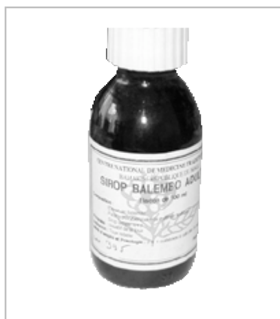
Figure 1 - Crossopterix febrifuga , Sirop Balembo.