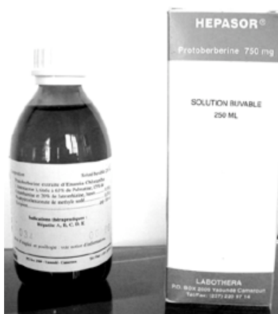
Figure 4 - Enantia chlorantha - Hepasor.