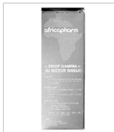
Figure 3 - P. brazzeana . Sirop Gamma.

proposés à la vente dans les officines pharmaceutiques du Mali et au niveau des centres de santé communautaires (2).