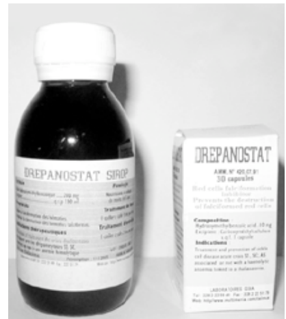
Figure 7 - Fagara xanthoxyloïdes - Drépanostat.

à partir de la même plante, la lotion Sebuma est antimicrobienne, antifongique, anti-inflammatoire et cicatrisante.